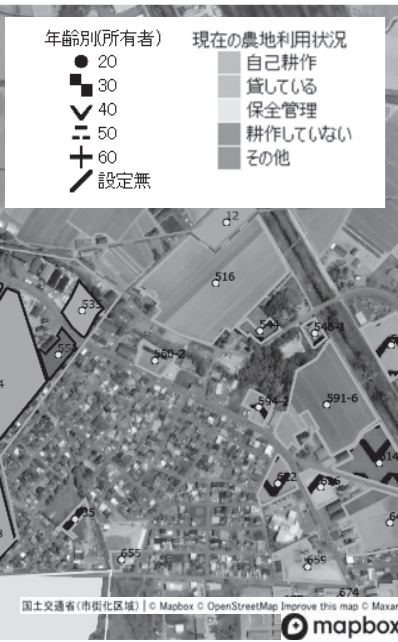
農業委員会サポートシステムで作成した目標地図素案 (デモ環境による架空のもの ※一部加工)

計画策定に係るQ&A集を作成したためその概要を説明。Q&A集は地域計画策定のメリット・デメリット、集落座談会での協議内容や参集範囲、集落で協議がまとまらなかった場合の対応など、今後の集落座談会の開催に向けた資料となっている。