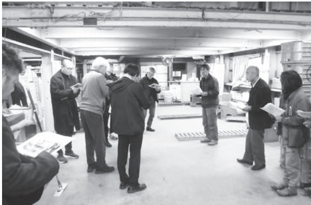
熱心に聞き入る香川県の一行

今回の交流会は、香川県農業経営者協議会が東大阪の中小企業等へ視察研修のために来阪する機会があり実現したもので、香川から会員の農業経営者等10人が、大阪からは14人が参加した。