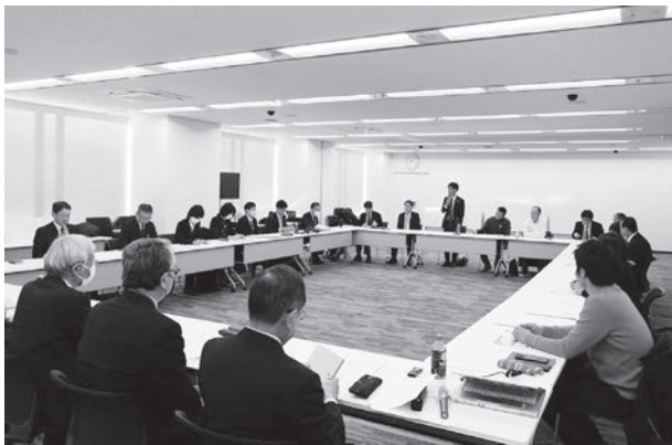
活発に担い手対策を話し合った

まず大阪府から、府内農業者は65〜74歳の層が多く2040年頃に多数の引退が見込まれる